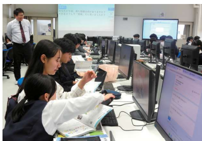
情報の授業は最新のPC環境で！