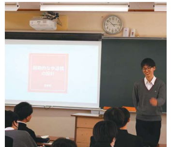
そして成果発表。全員もれなく発表出来ます。