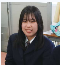
岡山市立南学園出身 書道部