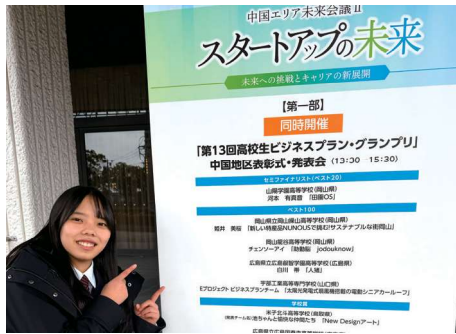
応募するのは私。その手順は自学自習です。