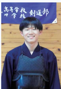
岡山市立岡北中学校出身 剣道部