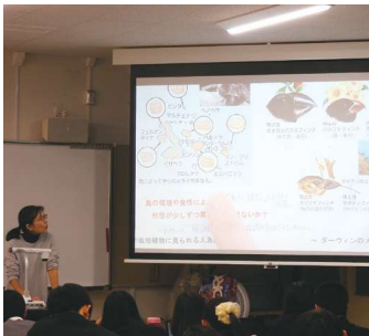
1年次は教科横断の授業を何種類も受講します。これで思考の枠を突破!