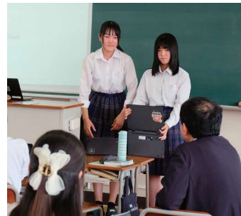
2年次では大学の先生からの助言を得て、精度を上げます。