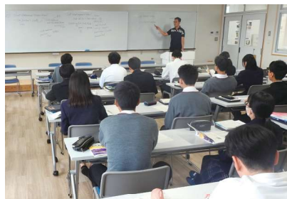
英語は内容の違いで「発展」「標準」を選べます。