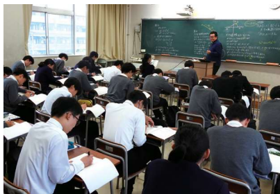
数学は進度の違いで「速修」「標準」を選べます。