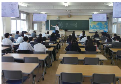
地理歴史の専用教室は大人数にも対応できます。