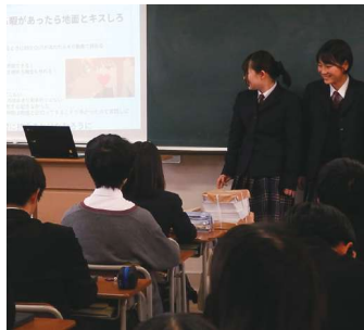
1年次から発表を経験します。慣れも大事です。