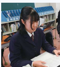
岡山市立京山中学校出身 卓球部