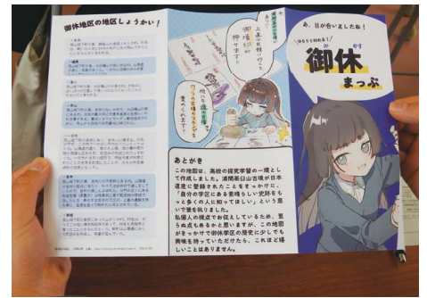
校内発表会を目指す。それが2年次のゴール。