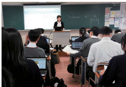
全教科でChromebookを活用します。