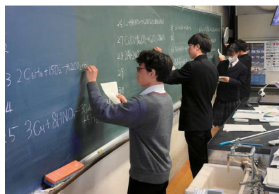
7つの理科教室で、実験も座学もすべて受けられます。