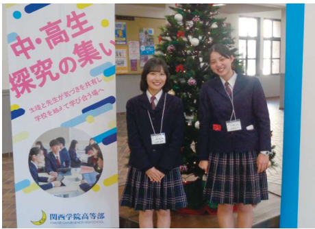
課題研究の成果を、全国の高校生と共有できます。