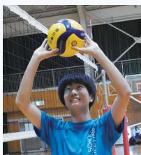
岡山市立京山中学校出身 バレーボール部